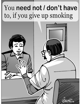
You need not / don't have to, if you give up smoking

next weekend. (ఇప్పుడు అవసరం లేదు, కానీ వచ్చే వారంతానికి తప్పకుండా ఇవ్వాలి.) Ramana: I have told them they have to pay the money now. (డబ్బు ఇప్పుడు కట్టాలని వాళ్ళకు చెప్పాను) Kumar: No, they need not. (లేదు. అవసరం లేదు) Need not = Don't/ Doesn't need. పై రెండు forms లో ఏదైనా వాడవచ్చు Gunavanth: Have I to take these medicines? (ఈ మందులు నేనిప్పుడు తీసుకోవాలా? ) Doctor: You need not/ don't have to , if you give up smoking. (నువ్వు సిగరెట్ మానేస్తే అవసరం లేదు) Srinath: Has he to carry all these things? (అతడు వీటన్నింటినీ తీసుకెళ్ళాలా? ) Jagannath: He need not/ doesn't have to , if we can get a taxi. (మనం taxi ని తెచ్చుకోగలిగితే అవసరం లేదు).