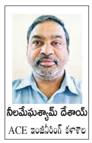
నీలమేఘశ్యామ్ దేశాయ్ ACE సంకీర్ణి కళాశాల

కమ్యూనికేషన్ వ్యవస్థ, కంప్యూటర్, నెట్వర్క్, రంగాల్లో జరుగుతున్న విప్లవాత్మక మార్పుల ఫలితంగా సమాచారం అందరికీ అందుబాటులో ఉండటం ఒక వరమైతే, అదే సమయంలో ఆ సమాచారానికి భద్రత లేక పోవడం ప్రమాదకరమైన విషయం. అందుకే ఆ భద్రత కల్పనలో భాగంగా నిపుణుల అవసరం రోజురోజుకీ పెరుగుతోంది.