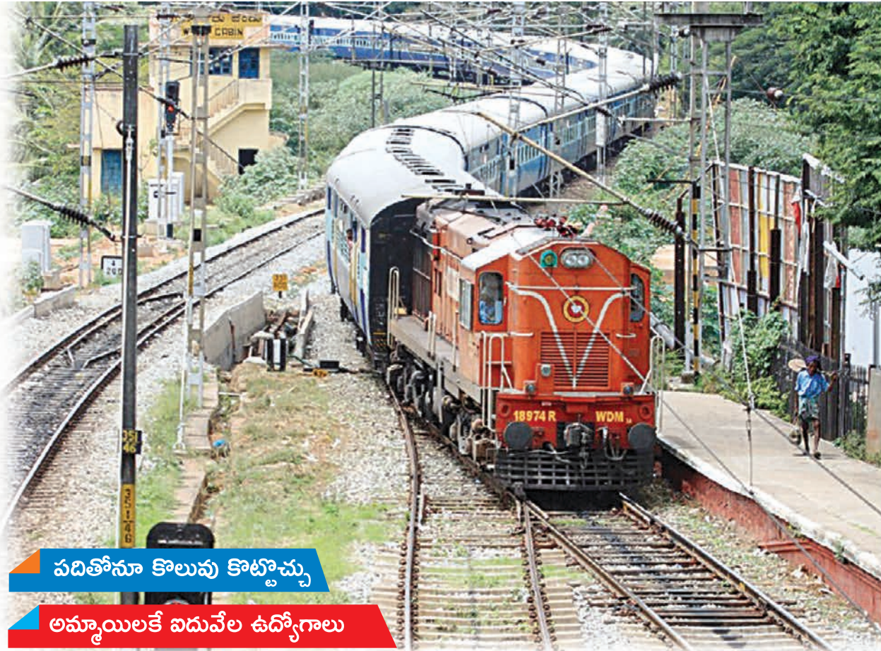
పదితోనూ కొలువు కొట్టొచ్చు అమ్మాయిలకే విడువేల ఉద్యోగాలు

కేంద్రప్రభుత్వ ఉద్యోగాన్ని సాధించాలనుకునేవారికి రైల్వే శాఖ అవకాశాన్ని మోసుకొచ్చింది. రైల్వే ప్రాటెక్ట్స్ ఫార్మ్, రైల్వే ప్రాటెక్ట్స్ స్పెషల్ ఫార్మ్ లో 8619 కానిస్టేబుల్ పోస్టుల భర్తీకి, 1120 సబ్ ఇన్స్పెక్టర్ పోస్టుల భర్తీకి ప్రకటన విడుదల చేసింది. కానిస్టేబుల్ పోస్టులకు విద్యార్హత కేవలం పదివరకే! ఎనివే పోస్టులకు డిగ్రీ! కానిస్టేబుల్ పోస్టుల్లో దాదాపు సగం పోస్టులను మహిళలకు కేటాయించటం విశేషం. పైగా చచ్చిన ఏ భాషలో నైనా పరీక్షను రాయగలిగే అవకాశం. అర్హతలున్నవారు దరఖాస్తు చేసి, పరీక్షకు సిద్ధమైతే ఆసించిన కొలువును చేజిక్కించుకోవచ్చు.